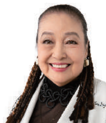
湯川 れい子先生 音楽評論家 / 作詞家 / 作家

1985年慶應義塾大学医学部卒業。慶應義塾大学医学部外科。(一般・消化器外科) 1998年英国オックスフォード大学博士課程修了。移植免疫学にてDoctor of Philosophy (DPhil) 取得。 2013年イグノーベル医学賞(大脳と免疫)受賞。2020年～新見正則医院院長。